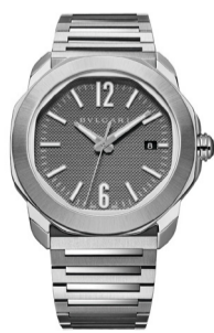
Часы Bvlgari Octo Roma