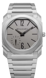
Часы Bvlgari Octo Finissimo

Время здесь оживает как символ вкуса, силы и уверенности, превращая каждую минуту в стильное утверждение личности.