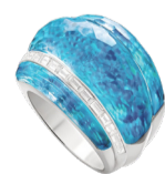
Кольцо Stephen Webster CH2