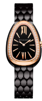
Часы Bvlgari Serpenti Seduttori