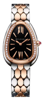
Часы Bvlgari Serpenti Seduttori