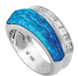
Кольцо Stephen Webster CH2