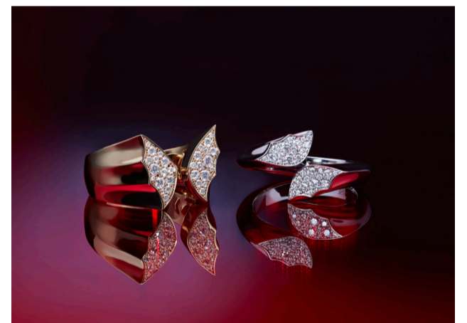
Серьги Stephen Webster CH2