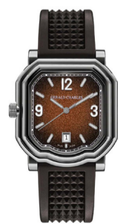
Часы Gerald Charles Maestro GC Sport