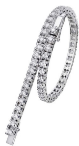
Браслет Fabio Collection Normal Tennis