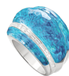
Кольцо Stephen Webster CH2