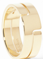
Кольцо dinh van Seventies