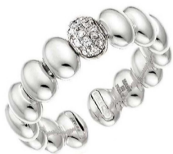
Кольцо Chimento Armillas Acqua