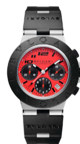
Часы Bulgari Bulgari Aluminium Ducati

Теннис, яхтинг, динамичная городская жизнь — Gerald Charles создаёт модели для мужчин, которые живут в ритме движения, не жертвуя элегантностью.