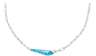
Колье Stephen Webster CH2