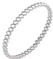
Браслет Chimento Armillas Acqua