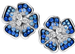
Серьги Leo Pizzo Flora