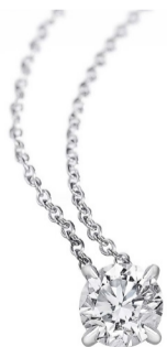
Колье Fabio Collection Diva