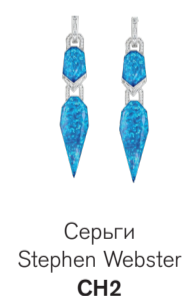
Серьги Stephen Webster CH2