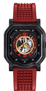
Часы Gerald Charles Maestro 4.0 Ducati