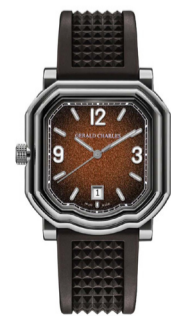
Часы Gerald Charles Maestro GC Sport