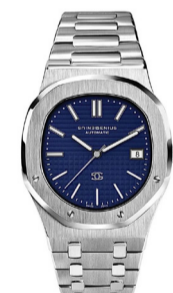
Часы Genius Portofino