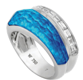
Кольцо Stephen Webster CH2