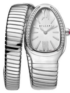
Часы Bulgari Serpenti Tubogas