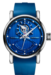
Часы Chronoswiss Resec