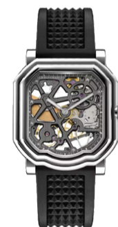
Часы Gerald Charles Maestro 8.0 Squelette