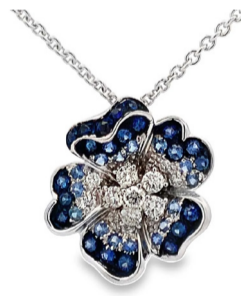
Колье Leo Pizzo Flora