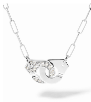
Колье dinh van Menottes