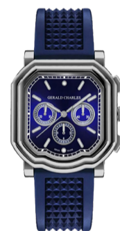
Часы Gerald Charles Maestro