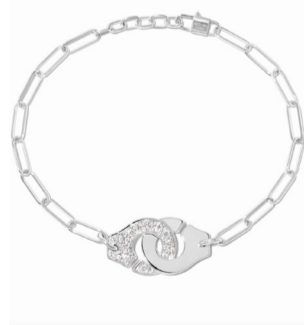
Браслет dinh van Menottes