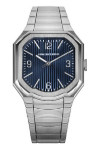
Часы Gerald Charles Masterlink