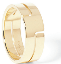
Кольцо dinh van Seventies