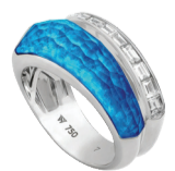
Кольцо Stephen Webster CH2