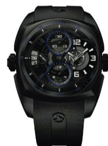
Часы Sygus Klepcys