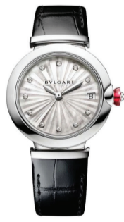
Часы Bvlgari Lvcea