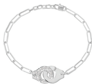
Браслет dinh van Menottes