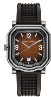
Часы Gerald Charles Maestro GC Sport