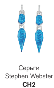
Серьги Stephen Webster CH2