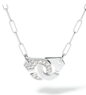
Колье dinh van Menottes