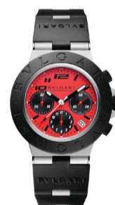
Часы Bvlgari Bvlgari Aluminium Ducati

Теннис, яхтинг, динамичная городская жизнь — Gerald Charles создаёт модели для мужчин, которые живут в ритме движения, не жертвуя элегантностью.