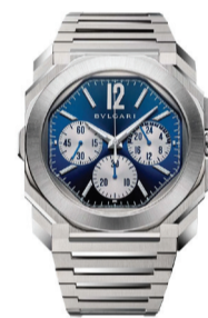
Часы Bvlgari Octo

Архитектурная выразительность Bvlgari, интеллектуальный дизайн Gerald Charles, традиционная механическая глубина Chronoswiss, технологичная смелость Sygus и динамичная современность Genius — каждый бренд раскрывает свою эстетику времени.