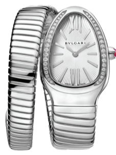
Часы Bvlgari Serpenti Tubogas